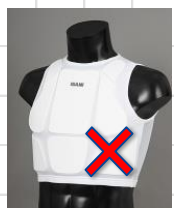
《着用不可のサポーター》