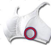
《着用OKのスポーツブラ》